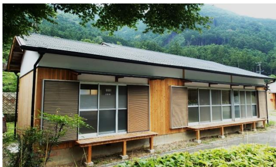
建物の1つ。内装の壁を塗り直します