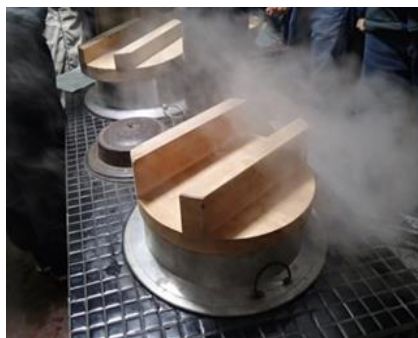
カマドごはんや五右衛門風呂も体験